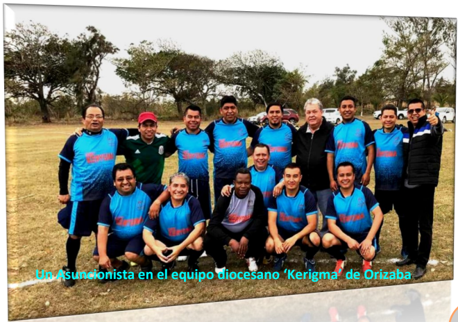
Un Asuncionista en el equipo diocesano 'Kerigma' de Orizaba