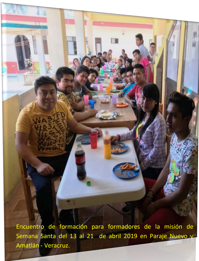
Encuentro de formación para formadores de la misión de Semana Santa del 13 al 21 de abril 2019 en Paraje Nuevo y Amatlán - Veracruz.