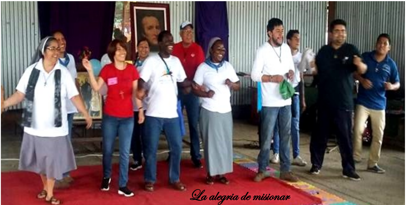
La alegría de misionar

En San Andrés Tenejapan, Ver. Somos tres hermanas, dos Congoleñas y una Chilena, su servidora. Queremos, primeramente, llegar al pueblo de Dios, ofreciendo nuestra presencia, la escucha solidaria y nuestro Carisma de Oblación.