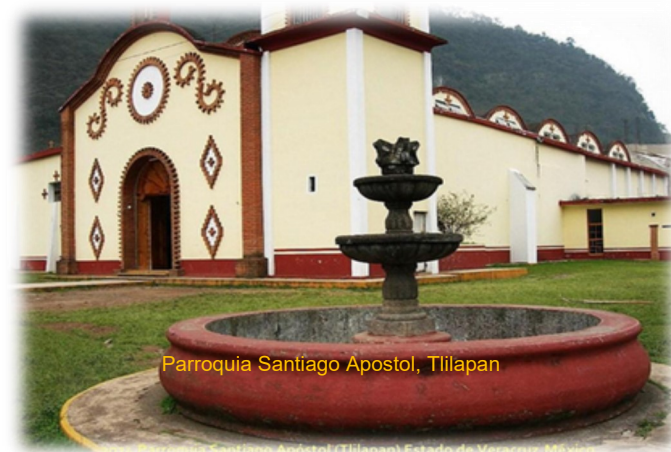
Parroquia Santiago Apostol, Tlilapan

La parroquia tiene diferentes retos en cada comunidad, pues tiene tres sectores en toda la comunidad parroquial: Urbana con las capillas de Jalapilla, Ahuehuate y Boquerón; semiurbano , con la cabecera parroquial y rural que es la zona